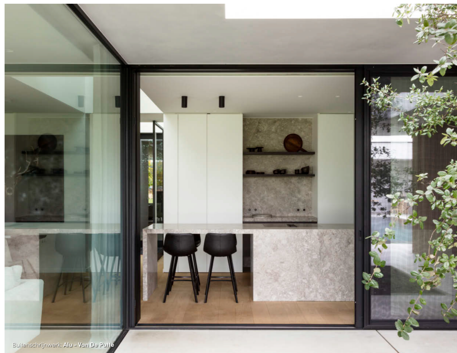
Buitenschrijnwerk: Alu - Van De Putte