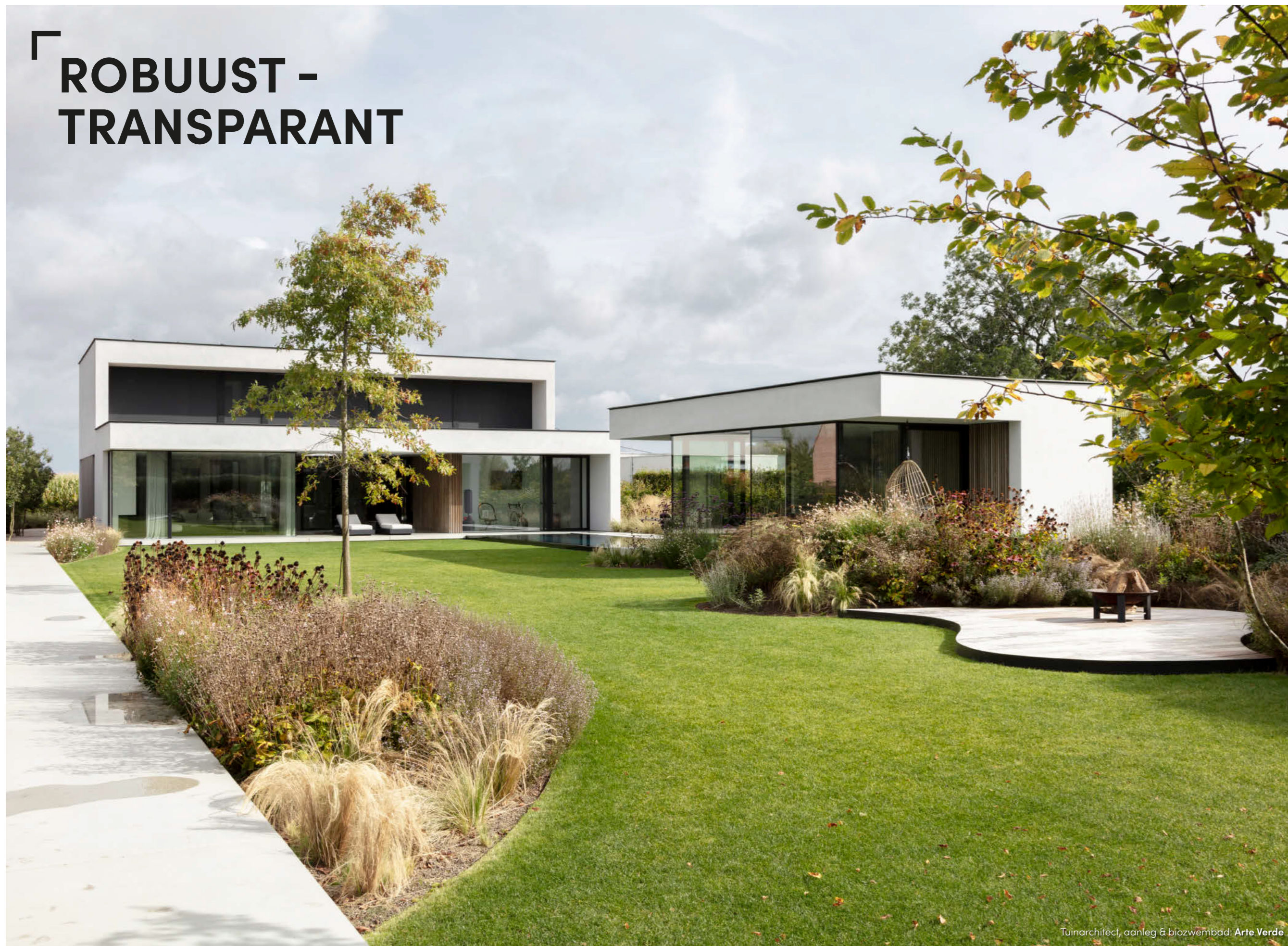
Tuinarchitect, aanleg & biozwembad: Arte Verde