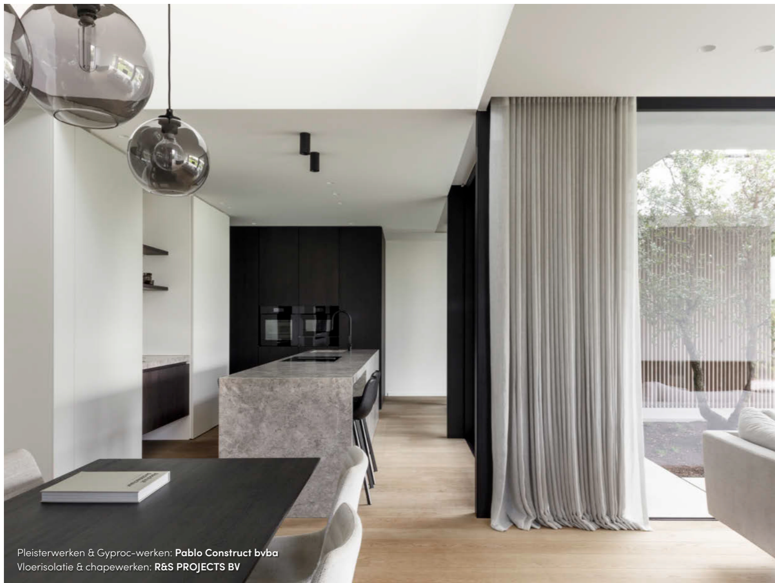
Pleisterwerken & Gyproc-werken: Pablo Construct bvba Vloerisolatie & chapewerken: R&S PROJECTS BV

“We zoeken opdrachten waarin de inbreng van zowel gebruikers en architecten als de invloed van de omgeving belangrijk en subtiel verweven zijn, waarin niet een ‘stijl’ maar een open visie het uitgangspunt is voor elke opdracht”, heet het.